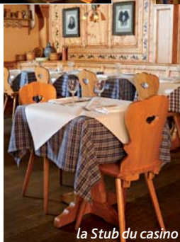
la Stub du casino