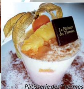
Pâtisserie des Thermes

R estaurants et salon de thé, partenaires de Niederbronn&Thermes, toujours soucieux de votre bien-être ont concocté des plats et entremets « minceur », délicats et équilibrés.